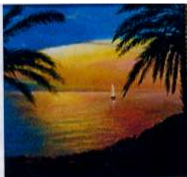
Фрагмент картины Тивернадское озеро.