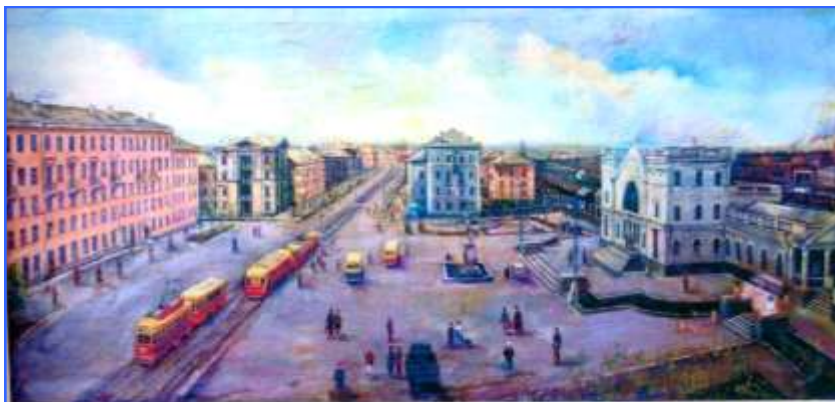
Новотроицк в 60-е годы.