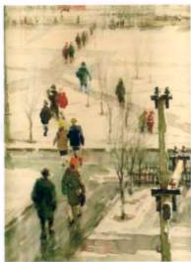
Апрель в Новотроицке.

По картинам «Закладка металлургического комбината» , «На Пушкинской улице» , «Наводнение» , «Первые бараки Новотроицка» и многих других можно проследить всю историю нашего города, тем более, что написано очевидцем событий с натуры, по памяти, и это делает