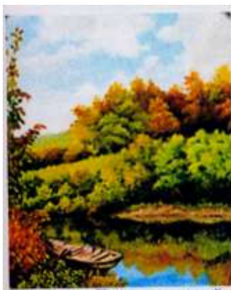
Пейзаж с лодкой.

Его пейзажи несут очень позитивную энергетику. На его полотнах много зелени, голубого чистого неба, поэтому они так приятны для глаз. Картины «Устье реки Известковый Лог» , «Наш сад» - очень ценные живописные воспоминания старожила города, соединяющие в себе художественную и историческую ценность.