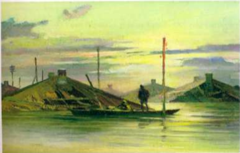
Наводнение 1957 года

В удивительно точных зарисовках природы Севера, Дальнего Востока, Урала, Средней полосы России, художник передал неповторимость, прелесть и индивидуальные особенности тех мест, где он побывал. Многогранность его таланта необыкновенна. Плетнев В.А. очень красочный художник. Использовал все оттенки радуги. В его работах настоящее буйство цвета и в то же время гармония и благородство. На первый взгляд, все его сюжеты довольно обычны, но всегда полны поэзии. В каждой его работе видна душа большого мастера, таланта от Бога.