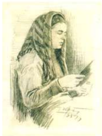
Письмо с фронта.