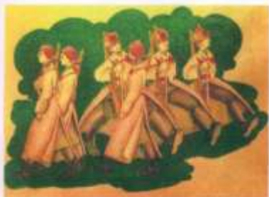
Дан приказ ему на запад.