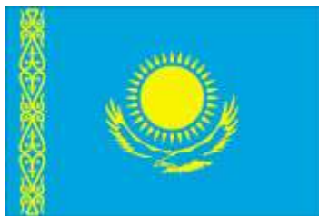
Государственный флаг республики Казахстан