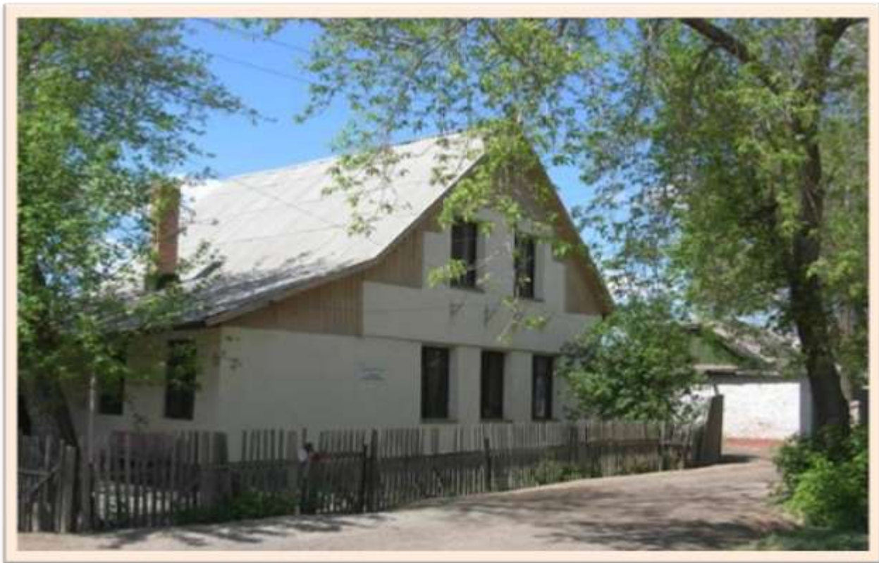
Улица имени И.Л. Рудницкого