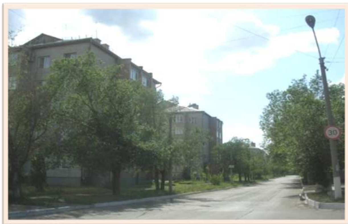
Улица имени Фрунзе