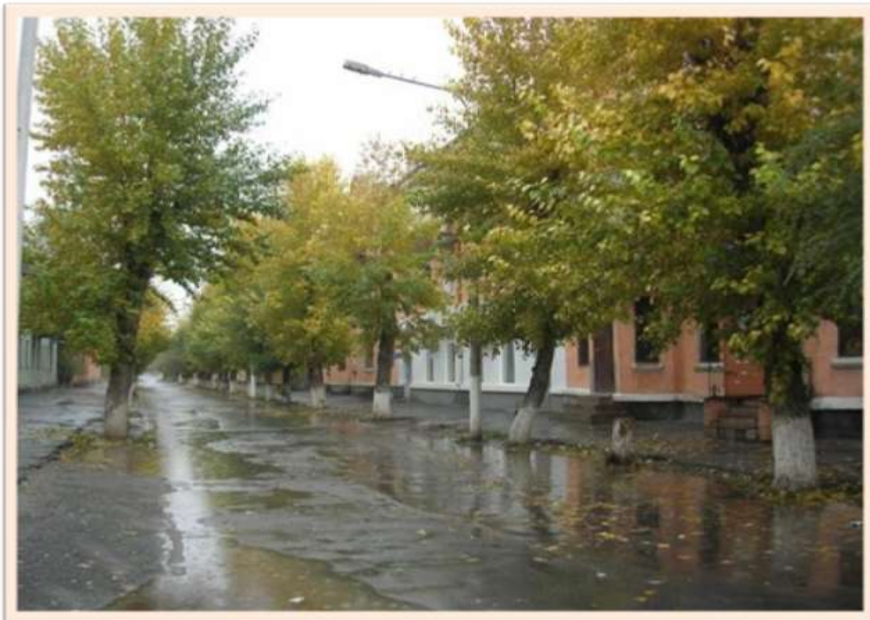
Улица имени Л.Толстого