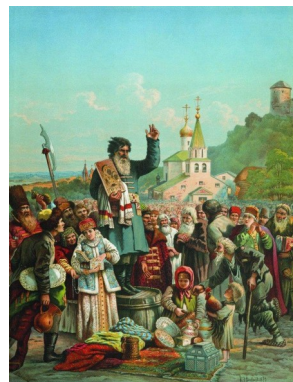
«Воззвание Кузьмы Минина к нижегород- цам»