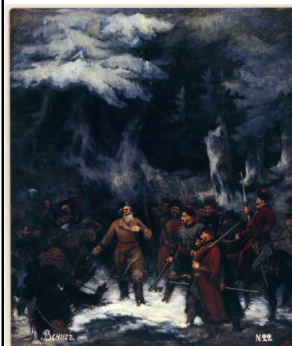
«Подвиг Ивана Сусанина»

Смутное время— период в истории России с 1598 по 1613. Период был очень трудным: гражданская война, польская и швед- ская интервенции, лже-цари и разоре- ние многих городов.