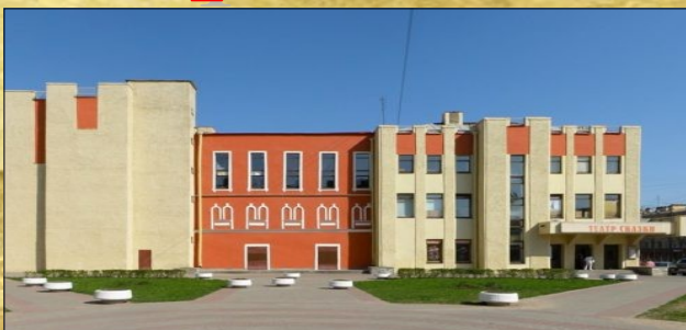
Санкт-Петербургский государственный кукольный «Театр сказки»

Свой первый спектакль Кукольный «Театр сказки» Санкт-Петербурга отыграл 31 декабря 1944 года. У истоков создания театра кукол стояли три ленинградские актрисы, которые вернулись с фронта и поняли, насколько детям того времени не хватало радости в жизни. Первое время Кукольный «Театр сказки» давал представления, кочуя от сцены к сцене, а уже в 1986 году Санкт-Петербургский кукольный театр сказки обрел свой дом.