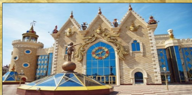
Татарский государственный театр кукол «Экият»

Свой первый спектакль Кукольный «Театр сказки» Санкт-Петербурга отыграл 31 декабря 1944 года. У истоков создания театра кукол стояли три ленинградские актрисы, которые вернулись с фронта и поняли, насколько детям того времени не хватало радости в жизни. Первое время Кукольный «Театр сказки» давал представления, кочуя от сцены к сцене, а уже в 1986 году Санкт-Петербургский кукольный театр сказки обрел свой дом.